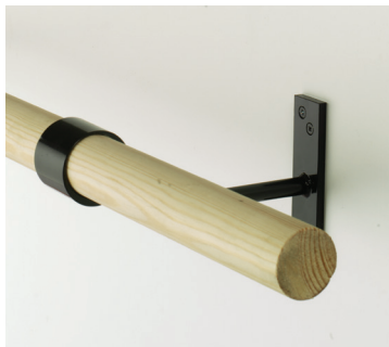
Murale simple 45 $