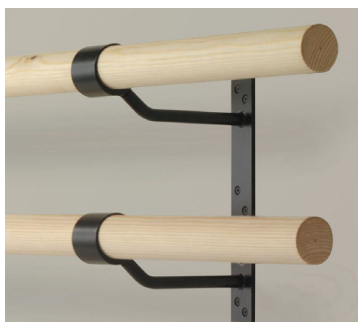
Murale double 76 $