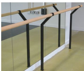
Fixée au sol simple 174 $