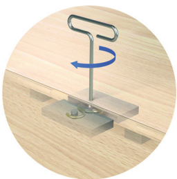
Sistema de cierre de llave de Harlequin